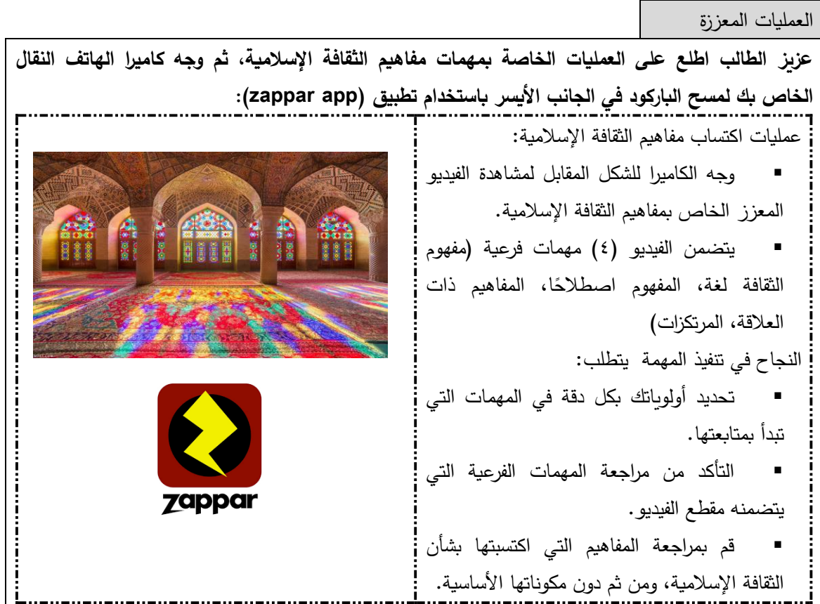
شكل (٢): العمليات المعززة بأنشطة الواقع المعزز المستخدمة