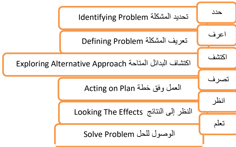
شكل (٣) حل المشكلات وفقاً لنموذج Bransford & Stein (بتصرف)

ينظر ميتشيل ورفاقه (Michelle et al, 2001) إلى مهارات حل المشكلة باعتبارها حزمة من مهارات التفكير الموجه نحو إيجاد بدائل حلول لمشكلة محددة عبر تشكيل استجابات وترجيح الأنسب منها عبر سلسلة من العمليات المعرفية الناقدة تمكن الفرد من أن يكون منتجاً للفروض، وقادراً على اختبارها، ومنظماً لخطة لوضع بدائل الحلول والتوصل إليها. مما يسهم في إكساب الأفراد أفكاراً جديدة حول موضوع معين فيتم تطوير المفاهيم والتعميمات والمهارات لاستعمالها في حل مشكلات بمواقف جديدة. وتعد حل المشكلات وسيلة من وسائل إثارة الفضول والاستمتاع العقلي التي تحفز عمليات التفكير وتنشط العمليات الذهنية. وقد تم تصميم نماذج متعددة لحل المشكلات منها نموذج برانسفورد وشتاين (Bransford & Stein, 1984) والذي وضع خطوات حل المشكلات كما يعرضها الشكل (٣).